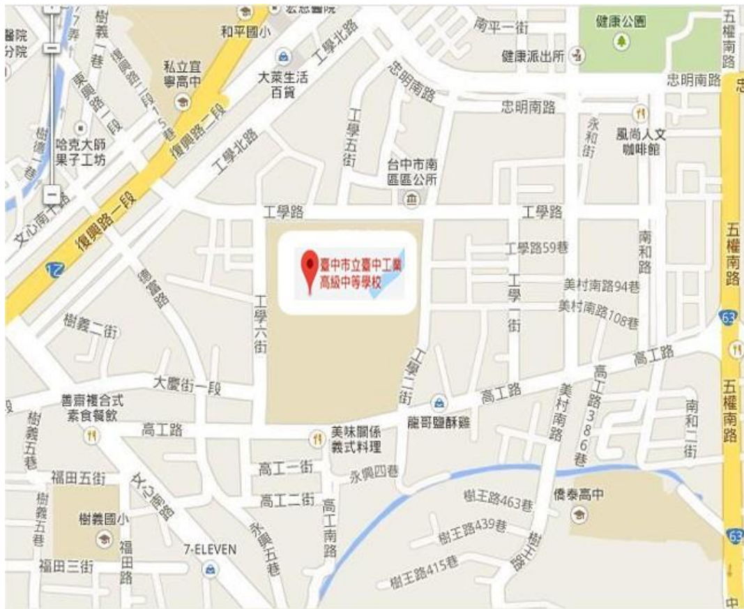
附圖一 承辦學校位置圖